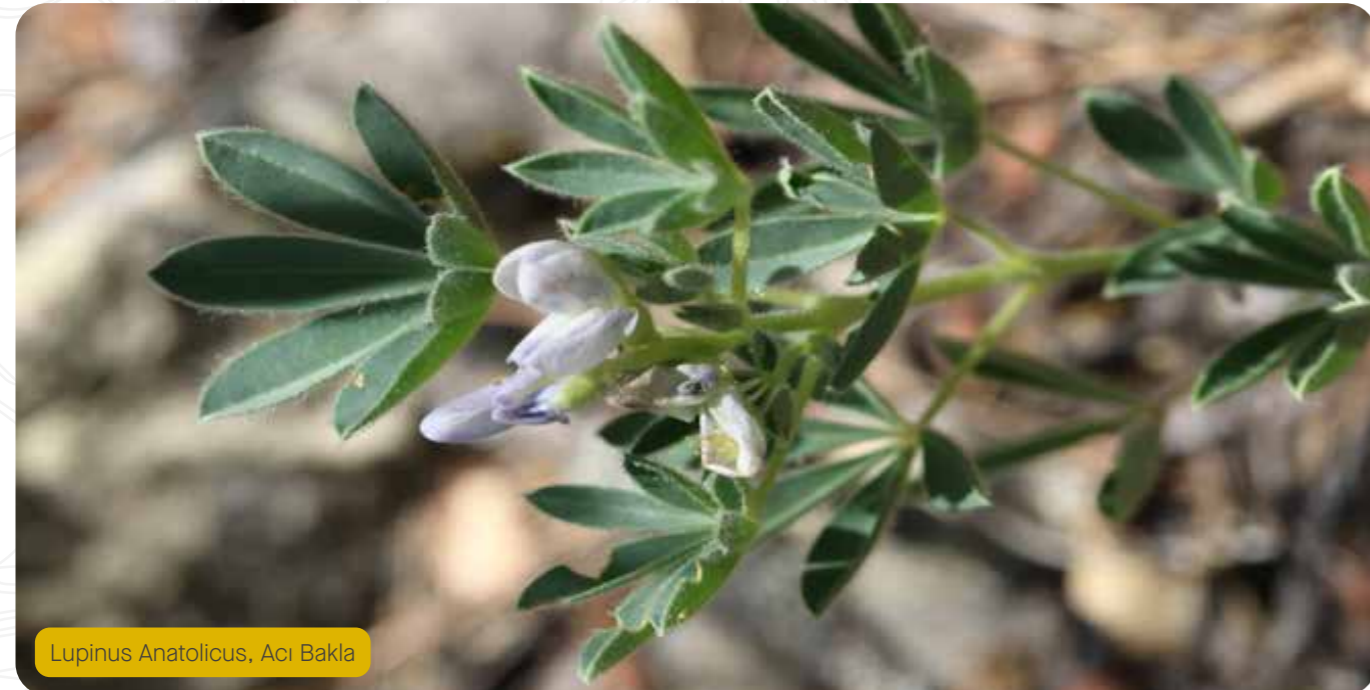
Lupinus Anatolicus, Acı Bakla

Flora izleme çalışmaları, belirlenen kritik flora türlerinin sahadaki yayılışının gözlemlenmesini içermektedir. Akademisyenler tarafından belirlenen bazı kritik türlerin tohum toplama çalışmaları yapılmış olup, tohumların kurutulmasından sonra maden alanındaki Botanik Bahçede ekimi gerçekleştirilerek bitki koruma çalışması yapılmıştır.